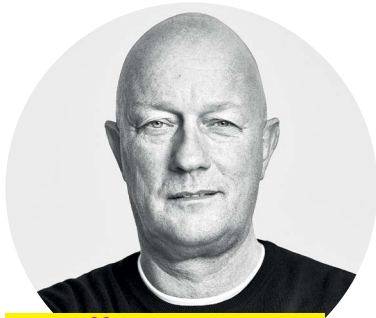
THÜRINGEN THOMAS L. KEMMERICH

Geburtstag: 20. Februar 1965 Geburtsort: Aachen Bildungsabschluss: kaufmännische Lehre, erstes juristisches Staatsexamen Berufliche Tätigkeiten: Unternehmer Politische Positionierung: Die FDP ist der Fels in der Brandung und damit der politischen Mitte