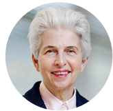
Dr. Marie-Agnes Strack-Zimmermann Spitzenkandidatin zur Europawahl

Bei der Europawahl kämpfen wir Freie Demokraten für Bürokratieabbau, bessere Rahmenbedingungen für neues Wachstum und mehr Freihandel.