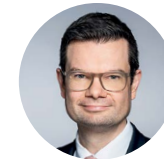
Dr. Marco Buschmann FDP-Präsidiumsmitglied & Bundesminister der Justiz

Deutschland steht am Rande eines Bürokratie-Burnouts, der Innovation hemmt und wirtschaftliches Wachstum behindert. Wir steuern dagegen!