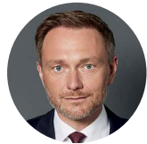
Christian Lindner FDP-Bundesvorsitzender & Bundesminister der Finanzen

Deutschland braucht strukturelle Reformen, wenn wir den wirtschaftlichen Turnaround schaffen wollen. Das Potenzial dafür ist im Land zweifelsfrei vorhanden, doch für die zwingend notwendige Wirtschaftswende muss es gehoben werden.