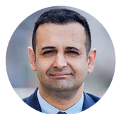
Bijan Djir-Sarai FDP-Generalsekretär

Die Diskussion um die Wirtschaftswende haben wir Freie Demokraten angestoßen, denn nur mit Wachstum können wir die gegenwärtigen Herausforderungen in Zukunft bewältigen. Dafür wollen wir jetzt die Weichen stellen.