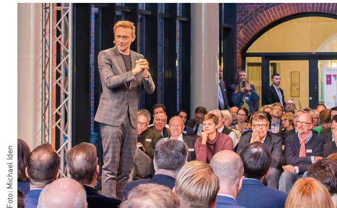
Christian Lindner während seiner Eröffnungsrede