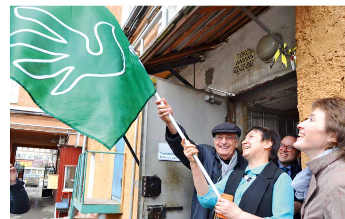
In Jekaterinburg hisst Gerhart Baum die Flagge der Menschenrechte

senschaft, haben die Türkei aus Furcht vor Verhaftung und Repressalien inzwischen verlassen; andere sitzen zum Teil seit Monaten in Haft und warten auf ihr Gerichtsverfahren. Unter den seit dem Juli-Putsch 2016 herrschenden Bedingungen des Ausnahmezustandes wägt man seine Worte besonders genau ab und überlegt, wo, mit wem und zu welchem Anlass man sich überhaupt politisch exponiert. Die kürzlich veranstaltete Ergebnispräsentation der Meinungsforschung der Stiftung zu „Liberalen Werten in der türkischen Gesellschaft“ beispielsweise, zu der früher eine reiche Auswahl hochrangiger Gesprächspartner zur Verfügung gestanden hätte, wurde zur Suche nach jenen, die sich noch trauen oder trauen können, in der Öffentlichkeit zu einem potenziell regierungskritischen Thema das Wort zu