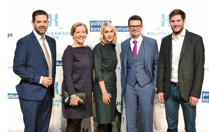
Freie Demokraten beim Politikaward 2016

Beim Politikaward 2016 haben die Freien Demokraten gleich mehrere Preise eingheimst. Sie waren fünfmal nominiert – und wurden dreimal geehrt. Allen voran Christian Lindner: Er erhielt die Auszeichnung als „Politiker des Jahres“. Die Jury begründete ihre Entscheidung mit der führenden Rolle Lindners bei der Erneuerung der FDP. Als kämpferischer Redner habe er seiner Partei neues Profil und Selbstbewusstsein gegeben. Der Bundesvorsitzende bedankte sich beim „tollen Team“ der Freien Demokraten: „Der Preis gehört Euch allen!“ Ein weiterer Grund zur Freude: In der Kategorie „Agentur des Jahres“ gewann Heimat den Politikaward. Zudem wurde die Wahlkampfaktion der FDP Berlin zum Brexit in der Kategorie „Virale Kommunikation“ ausgezeichnet.