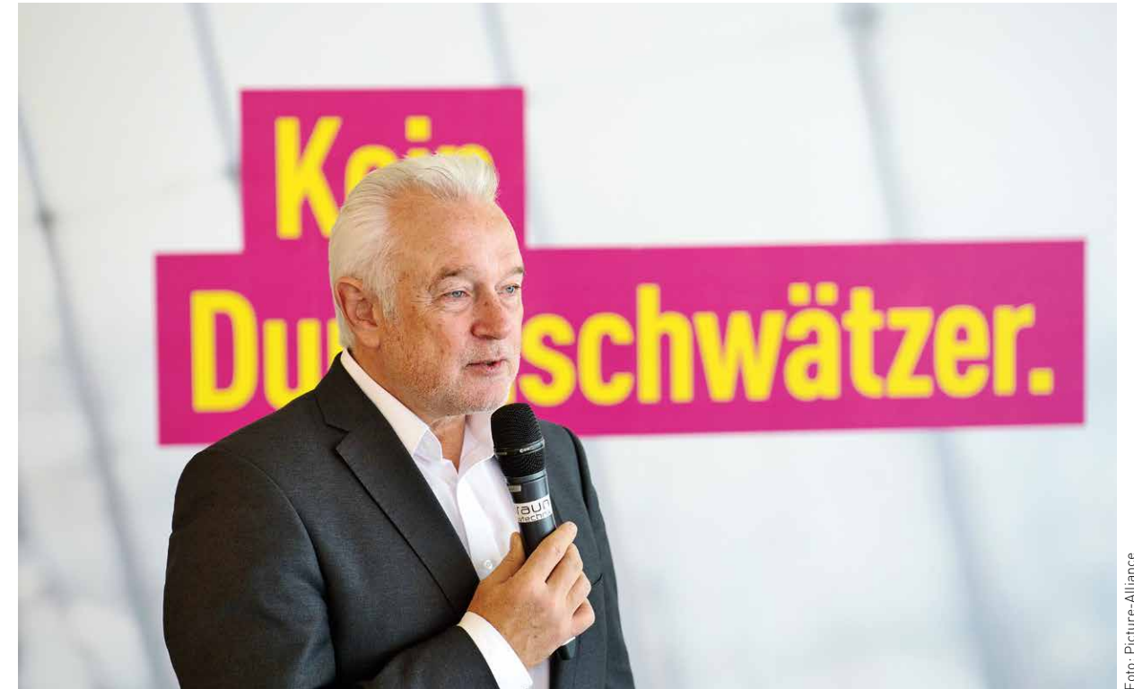
Wolfgang Kubicki stellt seine Kampagne vor

Die Freien Demokraten haben es selbst in der Hand, die nächsten Erfolge bei den Landtagswahlen einzufahren und sich damit in eine aussichtsreiche Ausgangssituation für die Bundestagswahl am 24. September zu bringen. Mit engagierten Wahlkämpfern und einer breiten Unterstützung der gesamten Partei wird die Operation erfolgreich sein.