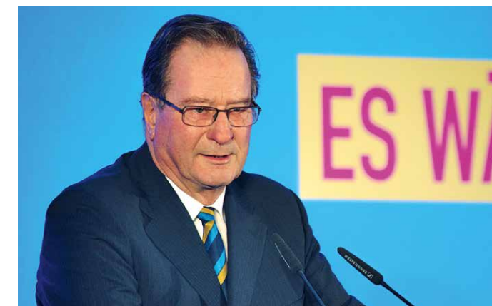
Klaus Kinkel spricht zu den Gästen

Der frühere Bundesaußenminister und FDP-Bundesvorsitzende Klaus Kinkel ist 80 Jahre alt geworden. Dies nahmen die Freien Demokraten zum Anlass, um mit Kinkel in Berlin zu feiern und seine Verdienste um Deutschland und Europa zu würdigen. Mit dabei waren zahlreiche Gäste und politische Weggefährten wie Bundesfinanzminister Wolfgang Schäuble. Kinkel habe sich „um diese Partei, aber vor allen Dingen auch um unser Land hoch verdient gemacht“, sagte Christian Lindner in seiner Laudatio. „Er verkörpert vieles von dem, was wir brauchen: Vernunft, Offenheit und Toleranz“, betonte Schäuble. In diesen gefährlichen Zeiten sei Kinkels Bekenntnis zu Europa und dessen Grundwerten nötiger denn je.