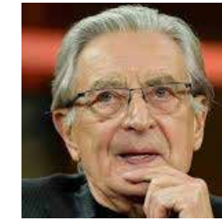
Gerhart Rudolf Baum