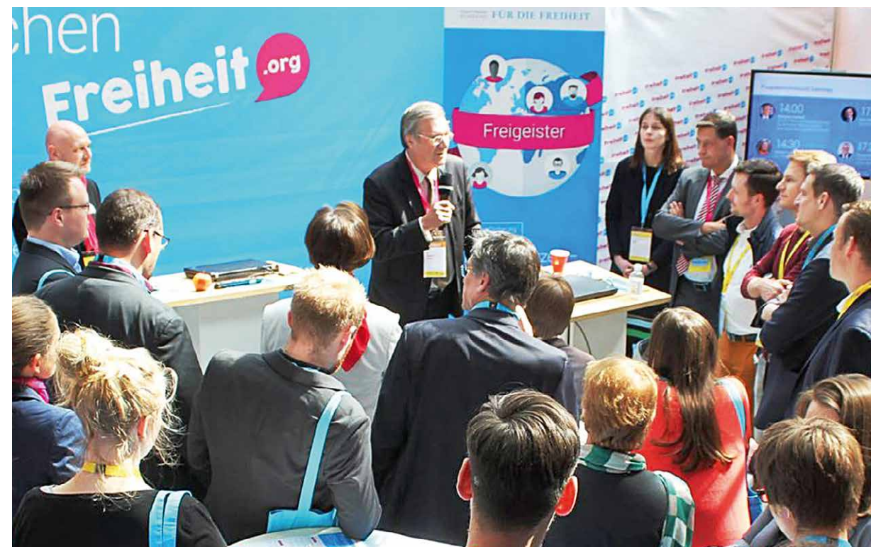
Infostand der Stiftung als Ort des politischen Gesprächs und direkten Austauschs

Es geht deshalb 2017 auch in Deutschland nicht um ein ganz normales Wahljahr, sondern um eine Richtungsentscheidung. Gelingt es die Menschen zu überzeugen, dass unsere Demokratie zukunftsfähige Antworten auf die großen Herausforderungen der Welt bereithält? Es gilt, den Wählern klarzumachen, dass unsere Demokratie genau dies leisten kann – durch ein liberales Programm. Mehr Wohlstand, der allen nützt; mehr Rechtsstaat, der konsequent durchgesetzt wird; und mehr Schutz vor Terror durch professionelle Arbeit von Polizei und Sicherheitsdiensten – das sind die großen Themen, die anstehen. Es sind Themen, die