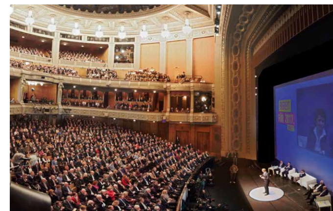
Christian Lindner redet im vollbesetzten Stuttgarter Opernhaus