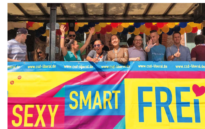
Freie Demokraten beim CSD in Hamburg

Auch diesen Sommer finden wieder zahlreiche Christopher Street Days in ganz Deutschland statt. Immer mit dabei: Die Freien Demokraten. „In ganz Deutschland feiern Menschen CSD-Paraden und -Straßenfeste, freuen sich über bunte Vielfalt und Freiheit und weisen auf weiter bestehende Diskriminierung hin“, betonte die stellvertretende Bundesvorsitzende Katja Suding. Der Bundesregierung warf sie vor, es bei Ankündigungen zu belassen. Die Ehe sei immer noch nicht geöffnet, der Nationale Aktionsplan gegen Homophobie nicht verabschiedet und die Entschädigung der Opfer des Paragraphen 175 Strafgesetzbuch ohne Einigung. Zudem würde die Bundesregierung zu internationalen Menschenrechtsverletzungen beharrlich schweigen.