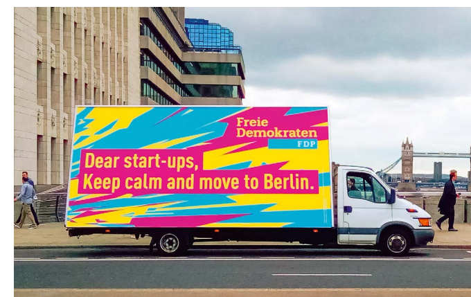
Die mobile Großfläche in London

Die Freien Demokraten Berlin sind der Auffassung, dass junge gründungswillige Briten eine Zukunft verdient haben. „Berlin muss die neue Heimat werden für alle, die in Europa etwas Neues aufbauen wollen“, erklärte Spitzenkandidat Sebastian Czaja und verband dies mit der Forderung an den Berliner Senat, endlich Hürden abzubauen. Die Aktion fand großen Widerhall in den sozialen Netzwerken und der Presse.