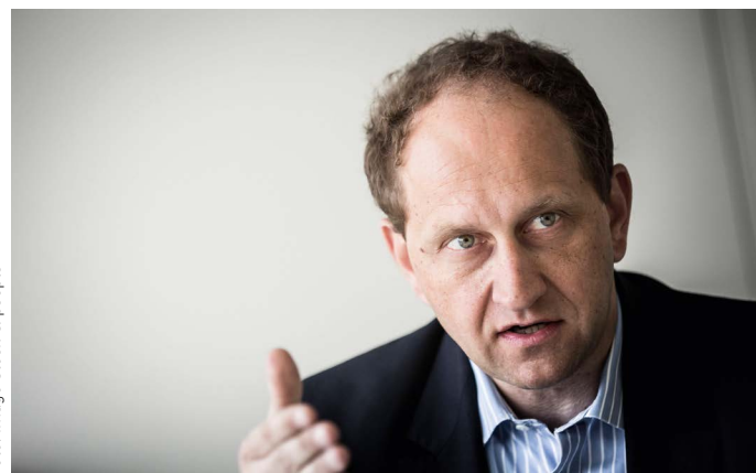
Alexander Graf Lambsdorff

immer zuschlagen kann. Und was passiert? De Maizière verspricht mehr europäische Zusammenarbeit. Das sind keine Fortschritte im Antiterrorkampf, das ist Augenwischerei. Europa braucht eine mutige Reform des europäischen Sicherheitsnetzwerks. Europol muss zu einem europäischem FBI mit eigenen Ermittlungskompetenzen entwickelt werden. Dabei ist der Grundrechtsschutz durch die Bindung von Europol an die liberale Europäische Grundrechtecharta gewährleistet. Wenn es Konflikte gibt, steht jedem EU-Bürger der Rechtsweg zum Gerichtshof offen.