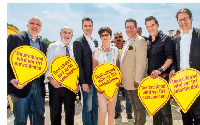
Kampagnenvorstellung beim Sommerfest der FDP Niedersachsen

Den Erfolg soll wie schon Anfang des Jahres in Hessen ein engagierter Wahlkampf samt einer professionellen Kampagne bringen. Diese wurde Ende Mai beim Aktionstag und Sommerfest der niedersächsischen Freien Demokraten in Hannover präsentiert. Unter dem Motto „Deutschland wird vor Ort entschieden“ soll das hervorragende Wahlergebnis aus Hessen überboten werden.