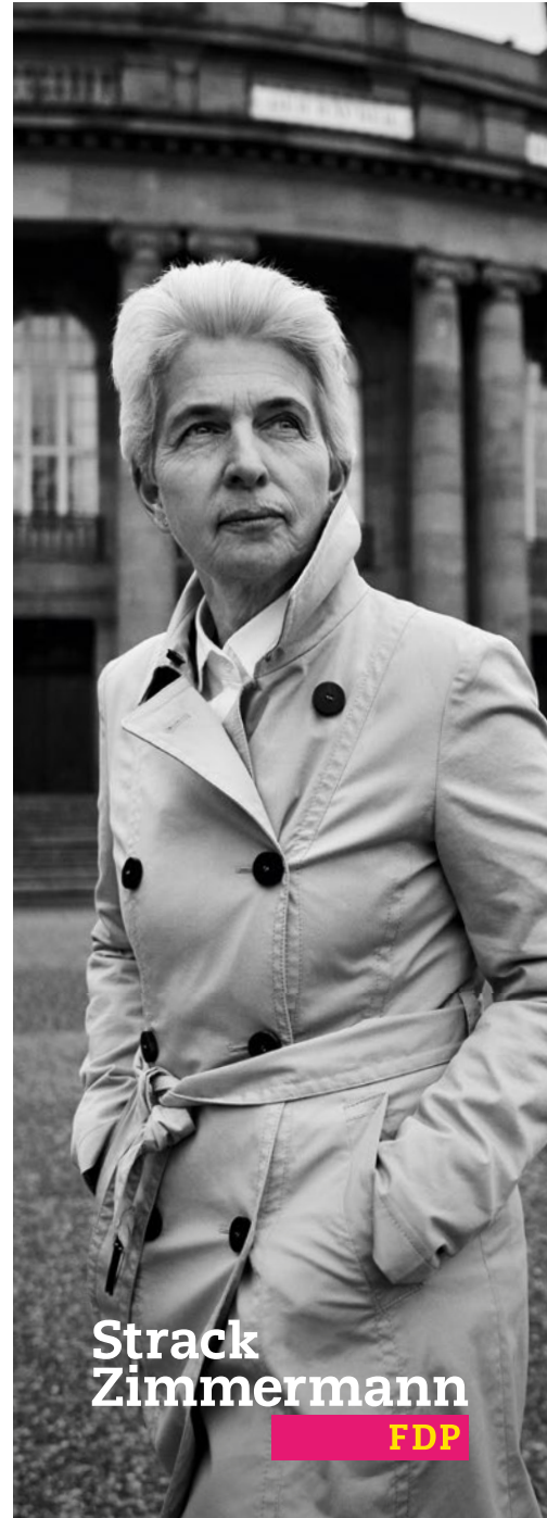
Strack Zimmermann FDP