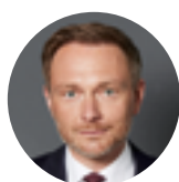
Christian Lindner FDP-Bundesvorsitzender & Bundesminister der Finanzen

Wir Freie Demokraten haben in schwierigen Zeiten Verantwortung übernommen. In der Regierungskoalition sind wir die Stimme der Mitte. Gleichzeitig ist es Aufgabe und Anspruch der FDP in der Bundesregierung, Deutschland endlich moderner, stärker und freier zu machen.