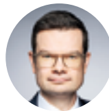
Dr. Marco Buschmann FDP-Präsidiumsmitglied & Bundesminister der Justiz

Um diesen Herausforderungen zu begegnen, erarbeitet das Bundesfinanzministerium gemeinsam mit dem Bundesjustizministerium ein Zukunftsfinanzierungsgesetz für Deutschland. Dabei verfolgen wir einen umfassenden Ansatz. Neben finanzmarktrechtlichen Anpassungen und der Fortentwicklung des Gesellschaftsrechts wollen wir auch die steuerrechtlichen Rahmenbedingungen verbessern. So werden wir den Zugang zum Kapitalmarkt verbessern und die Aufnahme von Eigenkapital erleichtern. Anhand von fünf Punkten lassen sich wesentliche Maßnahmen unseres Gesetzesvorhabens zusammenfassen: