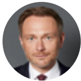
Christian Lindner FDP-Bundesvorsitzender & Bundesminister der Finanzen

Unser Land steht vor einer gewaltigen Aufgabe: Der russische Angriffskrieg samt seinen Folgen, der digitale Wandel und die Transformation hin zu einer klimaneutralen Wirtschaft erfordern Investitionen in nahezu beispiellosem Umfang. Sie erfordern die Erneuerung des Geschäftsmodells Deutschlands. Nur so können wir unseren Wohlstand unter den dramatisch veränderten Bedingungen sichern.