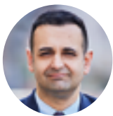
Bijan Djir-Sarai FDP-Generalsekretär

Der Iran erlebt derzeit einen revolutionären Prozess. Daraus könnte sich ein historisches Momentum für den gesamten Nahen und Mittleren Osten ergeben. Deutschland und Europa indes hinken der Entwicklung hinterher.