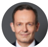
Dr. Volker Wissing FDP-Präsidiumsmitglied & Bundesminister für Digitales und Verkehr

Noch nie war es für die Menschen in Deutschland so einfach, Bus und Bahn zu nutzen. Mit dem Deutschlandticket wird ein attraktives und flexibles Angebot für alle geschaffen. Zugleich leistet es einen deutlichen Beitrag zum Klimaschutz.