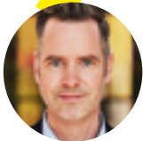
Christian Dürr FDP-Präsidiumsmitglied & Vorsitzender der Freien Demokraten im Deutschen Bundestag

Putin führt einen völkerrechtswidrigen Angriffskrieg gegen die Ukraine und einen Energiekrieg gegen Europa. Für die Menschen und Unternehmen in Deutschland folgen daraus gewaltige Herausforderungen. Rasante Preissteigerungen, insbesondere bei den Energiepreisen, sind für viele existenzbedrohend. Deswegen handeln wir entschlossen – mit fünf Antworten auf die Energiekrise.