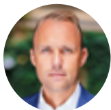
Sebastian Czaja Vorsitzender der FDP-Fraktion im Abgeordnetenhaus von Berlin & Spitzenkandidat

Mit der Entscheidung, die Abgeordnetenhauswahl zu wiederholen, setzt der Verfassungsgerichtshof Berlin der Dysfunktionalität der Berliner Verwaltung ein Denkmal. Offensichtliche Missstände wurden viel zu lange ignoriert. Die chaotischen Zustände gipfeln nun in einer Wahlwiederholung.